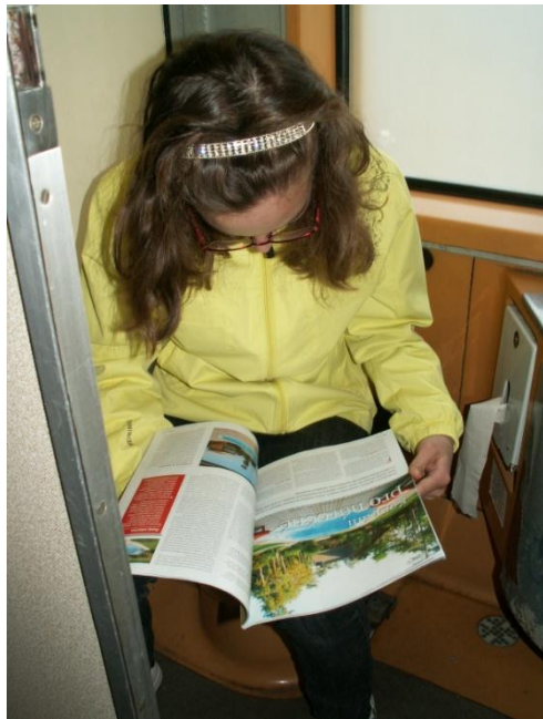
ze Rtně v P.