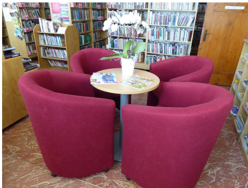
Nový koutek v dospělém oddělení knihovny