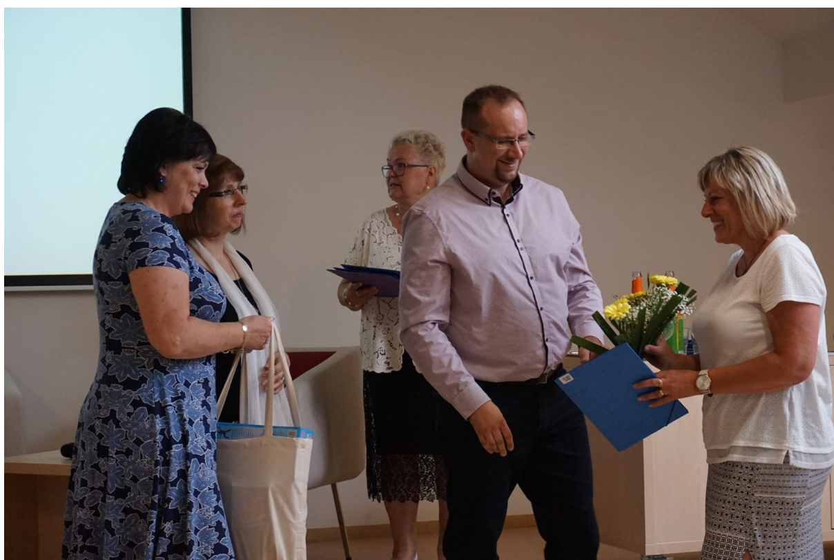
Předání ceny za třetí místo v soutěži dětských oddělení „Kamarádka knihovna“ v kategorii 3 000–5 000 obyvatel v Knihovně Jiřího Mahena v Brně

Adresa: Městská knihovna Rtyně v Podkrkonoší nám. Horníků 440 542 33 Rtyně v Podkrkonoší tel. 499 888 562, 772 720 881 e-mail: info@mkrtyne.cz www.mkrtyne.cz